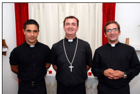
Clero de nuestra Congregación